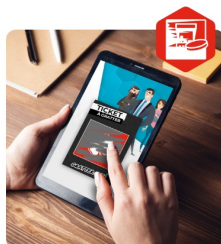
Ticket à gratter